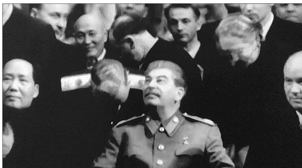
Шаяхметов на 70-летию Сталина в Большом театре СССР. 21 декабря 1949 года. На переднем плане Мао Цзедун, Иосиф Сталин, Долорес Ибарурри, Никита Хрущев.